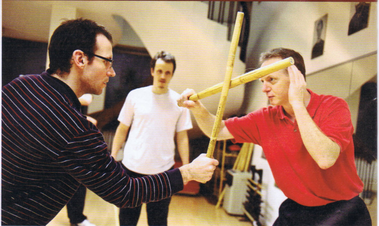
Schau mir in die Augen: Volle Konzentration beim Escrima-Probetraining